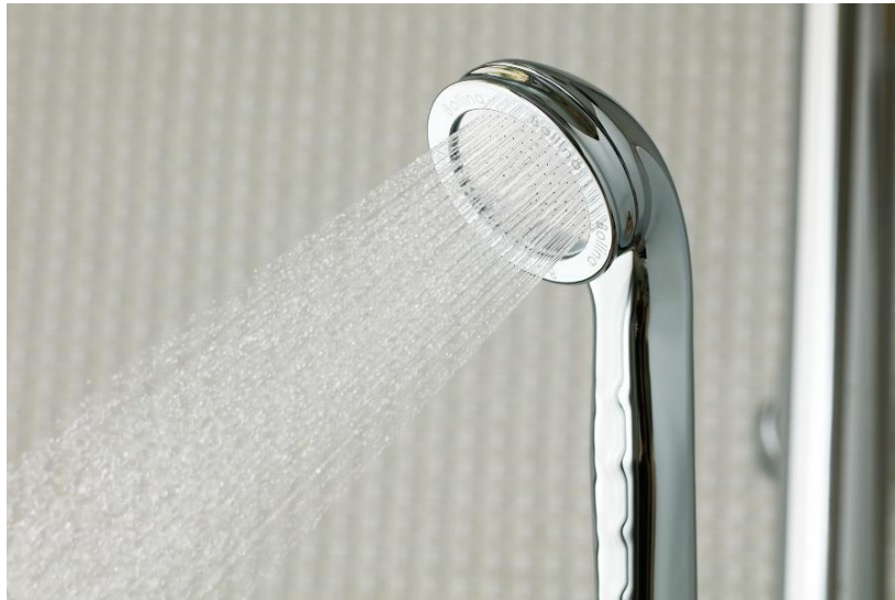
シリーズ累計販売本数100万本突破 ウルトラファインバブルシャワーヘッド『Bollina Wide Plus（ボリーナワイドプラス）』

※1：2024年2月20日時点 ※2：環境大臣が認定する特に先進的な環境保全活動に取り組む企業を認定する制度。