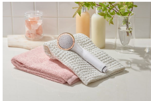
9月12日(木) 発売の新製品「PureLUS Fine (ピュアラスファイン)」