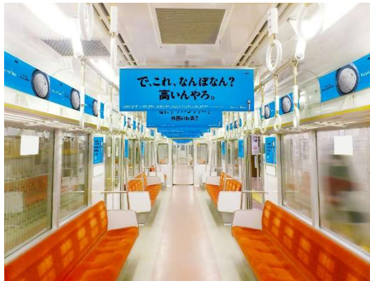
中吊り広告の掲載イメージ

ファインバブル ：マイクロバブル、ウルトラファインバブルの総称となる微細な泡のこと。洗浄・保湿・保温作用が期待されるほか、水産業・農業・医療等の幅広い業界で注目される技術です。当社製品は「 \mu -Jet機構(※1)」という独自の特許技術でこの泡を発生させています。