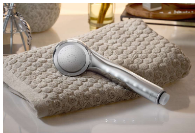
2026年7月15日(水) 発売 TK-A002-SL アヴァンティファイン (シルバー)